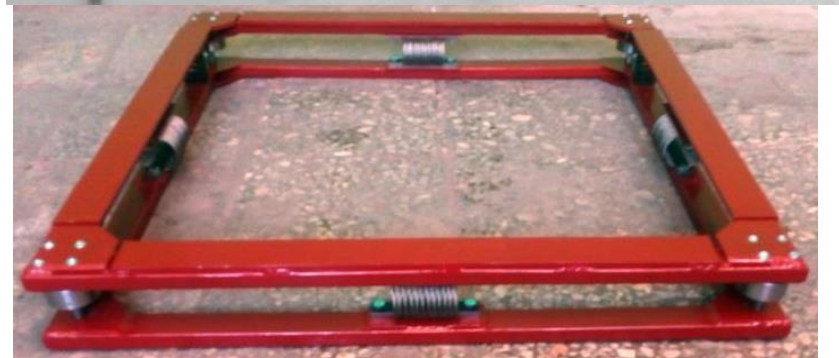
Примеры нестандартных изделий